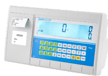
AE 504 Anzeigergeräte