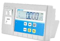
AE 503 Anzeigergeräte