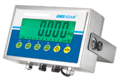
AE 403 Anzeigergeräte