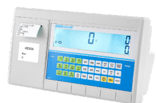
Indicateur AE 504