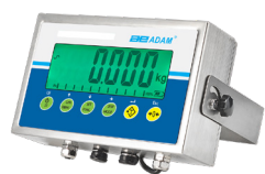
Indicateur AE 403