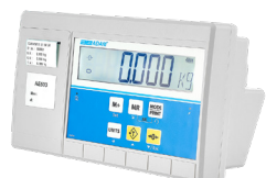
Indicateur AE 503